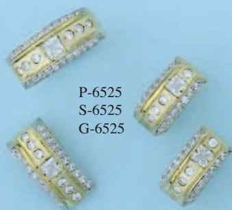
P-6525 S-6525 G-6525