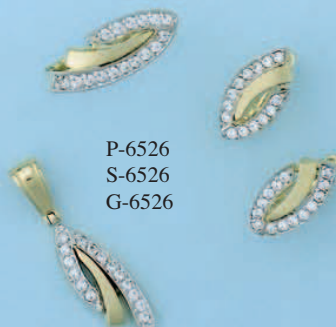
P-6526 S-6526 G-6526