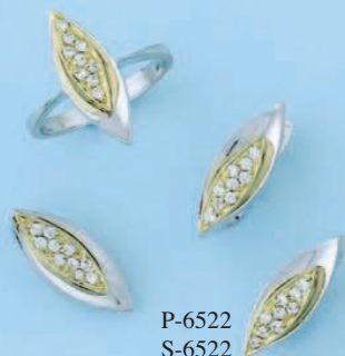
P-6522 S-6522 G-6522