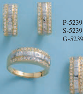
P-5239 S-5239 G-5239