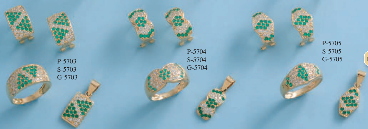
P-5703 S-5703 G-5703