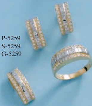
P-5259 S-5259 G-5259