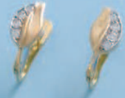
P-5258 S-5258 G-5258