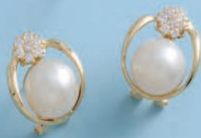
P-L1076 S-L1076 G-L1076