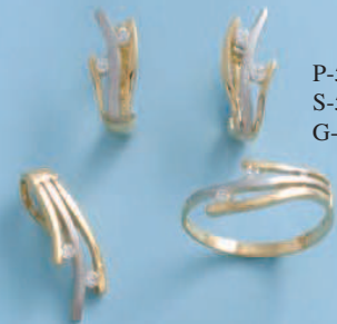
P-5223 S-5223 G-5223