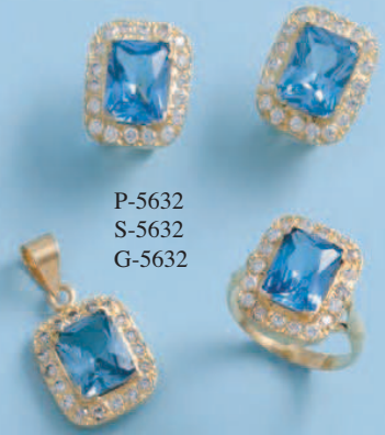
P-5632 S-5632 G-5632