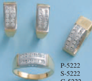
P-5222 S-5222 G-5222