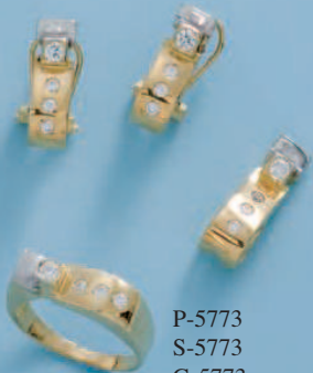
P-5773 S-5773 G-5773