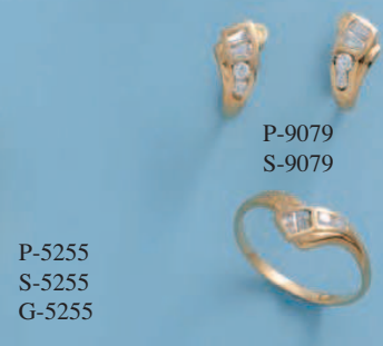
P-5255 S-5255 G-5255