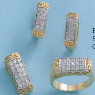
P-5237 S-5237 G-5237