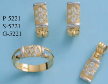
P-5221 S-5221 G-5221