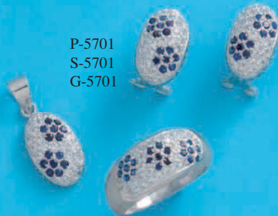
P-5701 S-5701 G-5701