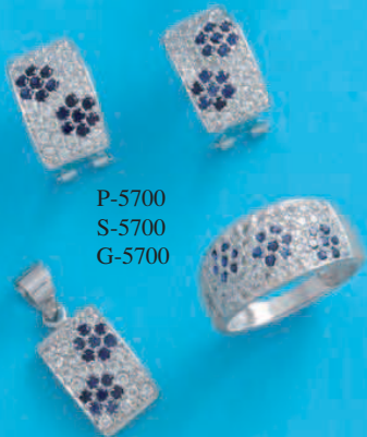
P-5700 S-5700 G-5700