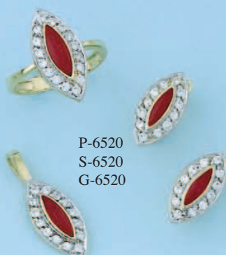
P-6520 S-6520 G-6520