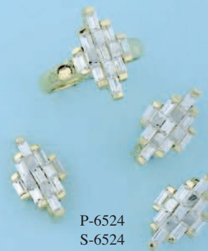
P-6524 S-6524 G-6524