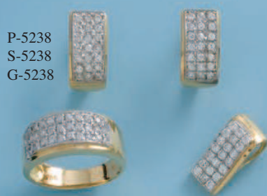
P-5238 S-5238 G-5238