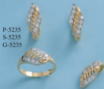
P-5235 S-5235 G-5235