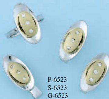
P-6523 S-6523 G-6523