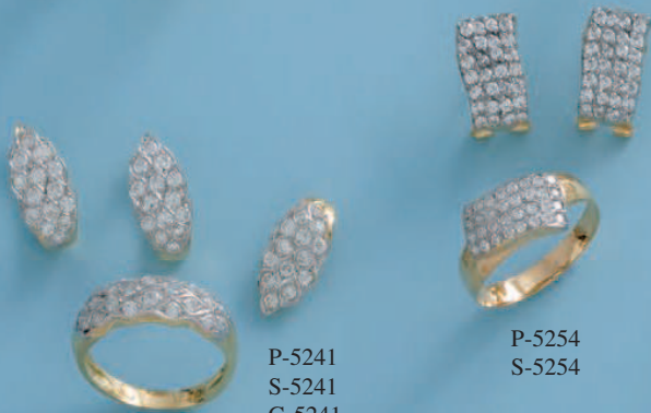
P-5241 S-5241 G-5241