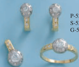
P-5240 S-5240 G-5240