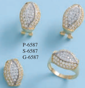
P-6587 S-6587 G-6587