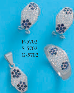
P-5702 S-5702 G-5702