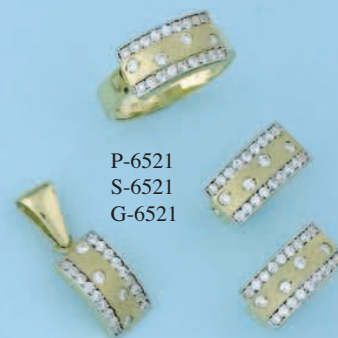
P-6521 S-6521 G-6521