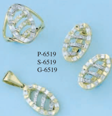
P-6519 S-6519 G-6519