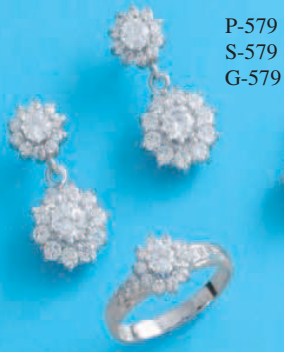
P-579 S-579 G-579