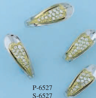
P-6527 S-6527 G-6527